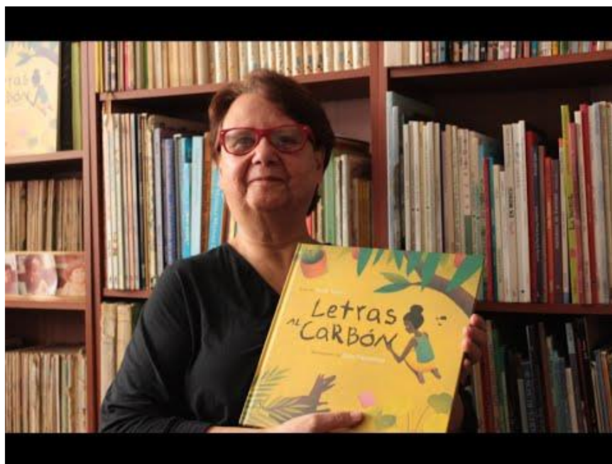
Imagen 2. Irene Vasco.

Irene Vasco escritora colombiana nacida en Bogotá en 1952, relacionada desde todos los ámbitos al mundo de los libros. Ha publicado destacados libros