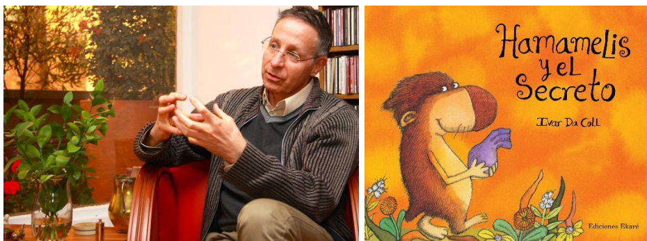
Imagen 3. Ivar Da Coll y su libro Hamamelis y el secreto .