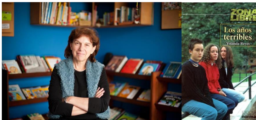
Imagen 5. Yolanda Reyes y su libro Los años terribles .