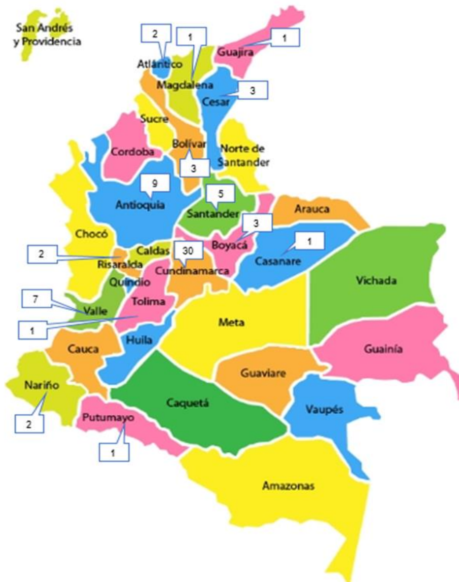
Figura 4 Consolidado sociedades BIC registradas en Colombia al mes de abril de 2020 - Elaboración propia

De la información obtenida, fácilmente podemos evidenciar que aunque cualquier tipo societario está en capacidad de adquirir la condición (BIC), hasta el momento solo han estado interesadas en hacerlo las sociedades por acciones simplificadas (S.A.S.), creadas con la ley 1258 de 2008, esto puede deberse a que este tipo societario cuenta con el régimen jurídico y comercial más novedoso, además de proveer a los accionistas la posibilidad de máxima