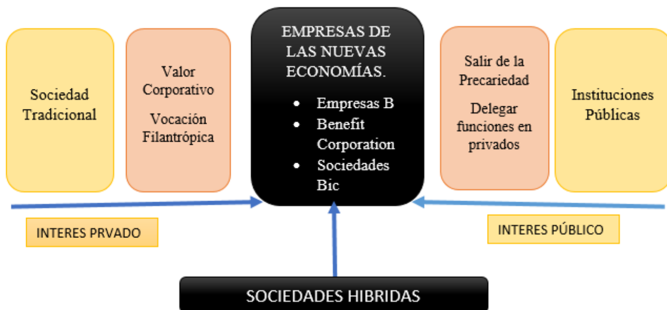
Figura 3 Intereses concurrentes en una sociedad híbrida.

Podríamos definir estas sociedades como aquellas que nacen producto de un proceso de mutación entre diferentes factores de mercado que crean instrumentos que sirven para contribuir los bienes de intereses públicos.