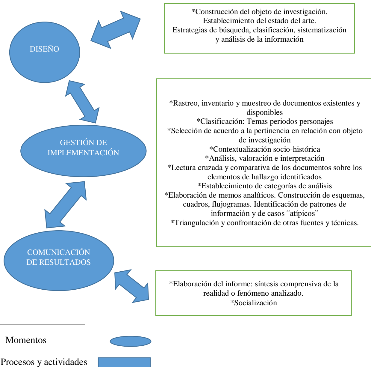
Figura 1. Proceso metodológico de la investigación documental