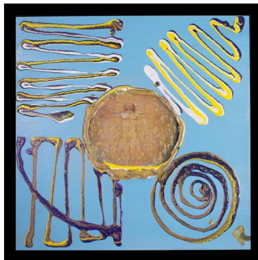
Figura 7. El ser busca comprender e interpretar el mundo, la ciencia y el ser humano

Fuente: Ilustraciones en acrílico sobre madera elaborado por el autor