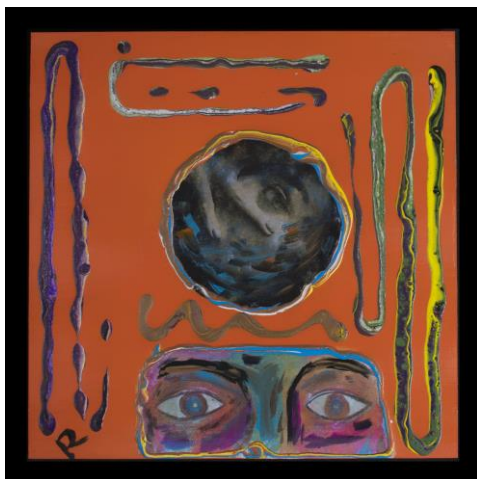
Figura 2. La educación del individuo es un camino que busca el reconocimiento de su ser en el aquí y el ahora

4.3.1 La educación del individuo es un camino que busca el reconocimiento de su ser en el aquí y el ahora.