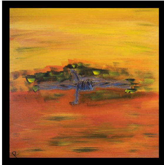
Figura 5. El complejo de inferioridad del suramericano está en relación con la falta de identidad

Fuente: Ilustraciones en acrílico sobre madera elaborado por el autor