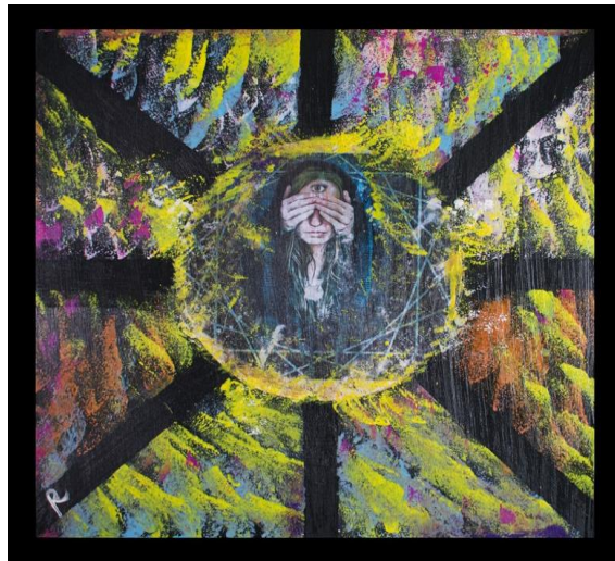
Figura 4. El ser humano y su asombro son parte de la emoción de crear belleza y de estar en comunión con el universo para elevar su conciencia

Fuente: Ilustraciones en acrílico sobre madera elaborado por el autor