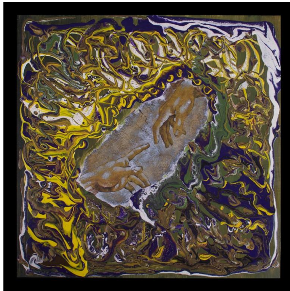
Figura 6 La experiencia es una herramienta didáctica que busca trascender la escuela y liberar al ser humano de la esclavitud espiritual

Fuente: Ilustraciones en acrílico sobre madera elaborado por el autor