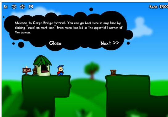
Figura 2. Cargo Bridge