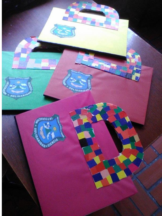
Imagen 1. Maleta viajera