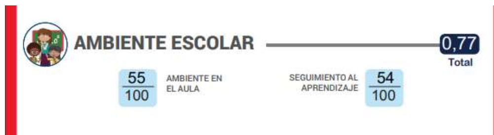
Figura 1. Porcentaje obtenido en el ISCE, Ambiente Escolar año 2017

Para el año 2017 el reto Institucional recaía en obtener puntajes óptimos en cada ámbito a evaluar, sin embargo, como se refleja en la gráfica expuesta a continuación, el ambiente escolar fue el aspecto en el que el porcentaje no resultó el esperado, porque a pesar de haber superado el MMA, sigue la tarea de reforzar el clima de aula y la convivencia escolar en general.