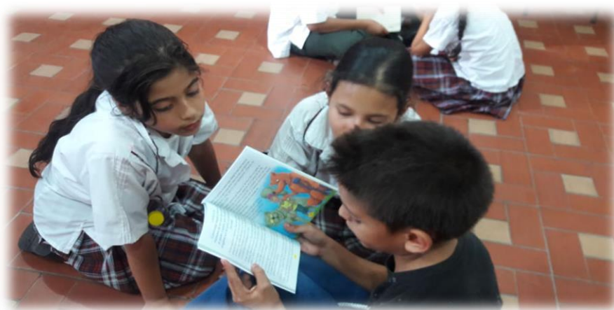
Figura 33. Actividades de lectura con estudiantes de cuarto grado

La metodología de la presente propuesta pedagógica consiste en la planeación, ejecución y reflexión de ocho encuentros los cuales serán nombrados, descritos detalladamente y soportados por registros fotográficos en el punto 4.7 DISEÑO DE ACTIVIDADES, de este mismo capítulo.