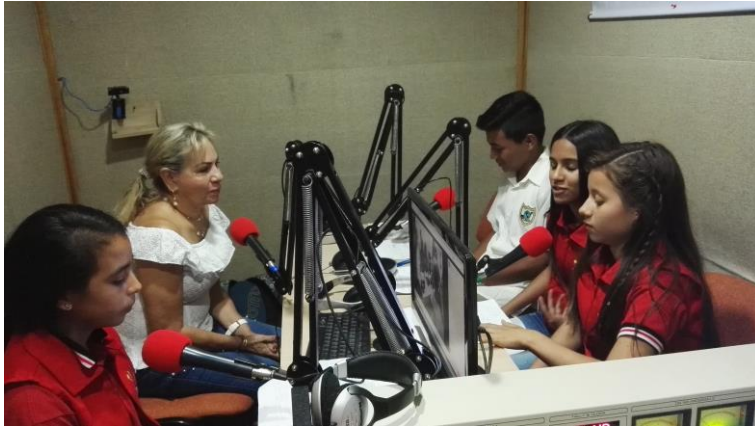
En cabina con la rectora de la Institución.