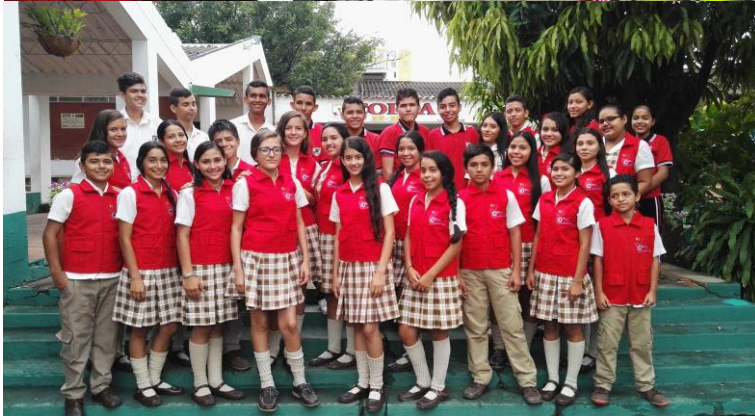
Entrega de distintivo radial