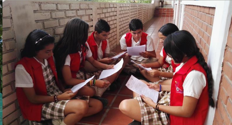
Revisión del guión radial