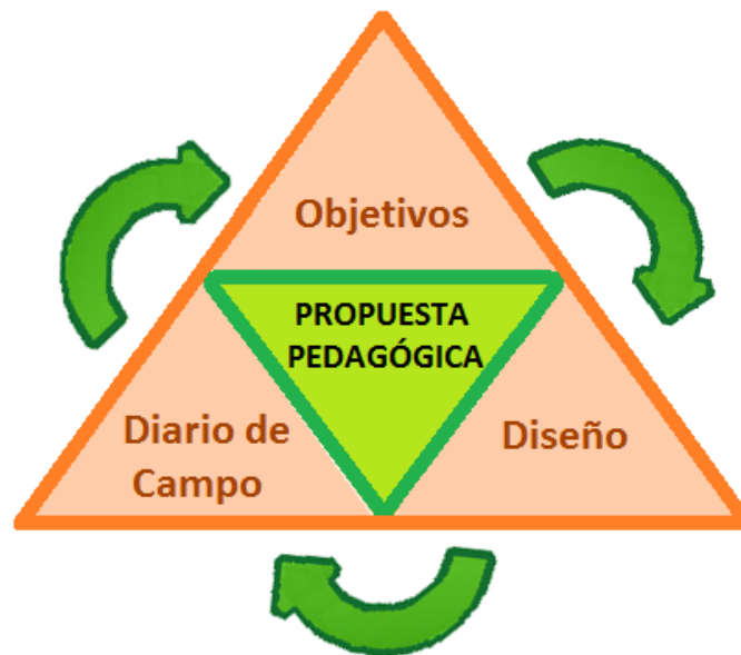
Ilustración 1 Triangulación. Producción del autor

El gráfico anterior nos propone claramente los tres aspectos fundamentales que consolidan la propuesta pedagógica “Proyecto de aula” siendo esta el centro de la triangulación. En primer lugar se encuentran los objetivos propuestos que están íntimamente relacionados con el objetivo general del proyecto encaminados al fortalecimiento de la comprensión e interpretación textual en los niños del grado tercero de la sede Número Uno. Luego el diseño del proyecto de aula establecido en tres fases cada uno con unos objetivos específicos, la inicial o de motivación, de desarrollo y la fase final o de evaluación. Por último encontramos el diario pedagógico que recoge información importante que permite analizar los avances, progresos y ajustes pertinentes. Todo esto relacionado entre sí porque los objetivos propuestos requieren el diseño de un plan de acción que se registra en el diario pedagógico.