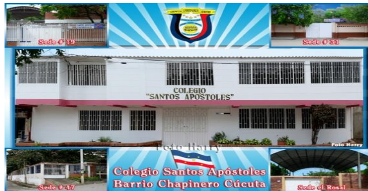
Figura 1. Foto Colegio Santos Apóstoles Barrio Chapinero – Cúcuta