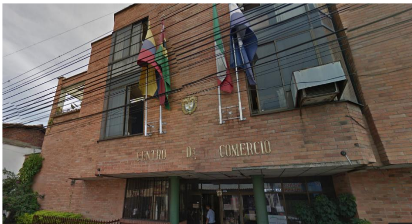
Ilustración 1. Colegio Centro de Comercio Sede A.

El Centro de Comercio es una institución educativa formal de carácter oficial, de naturaleza mixta, que ofrece los niveles de preescolar, educación básica y media en la modalidad comercial, ubicada en el municipio de Piedecuesta, localidad perteneciente al área metropolitana de Bucaramanga, que busca contribuir a la construcción de la identidad cultural local, regional y nacional, así como también fortalecer el desarrollo integral de la persona humana. El colegio atiende estudiantes de los estratos socioeconómicos del 1 al 3 y la fuente de ingresos de los padres es el trabajo independiente, empleados de fábricas, ventas ambulantes y un bajo porcentaje se ocupa en labores que les permiten devengar salarios estables y/o bien remunerados, debido al bajo nivel académico de la mayoría; cabe resaltar, que el cuidado de los hijos no siempre está bajo la responsabilidad de los padres, sino por múltiples razones (trabajo, abandono, despreocupación, entre otras) los niños y jóvenes son cuidados por los abuelos, tíos y/o padrinos.