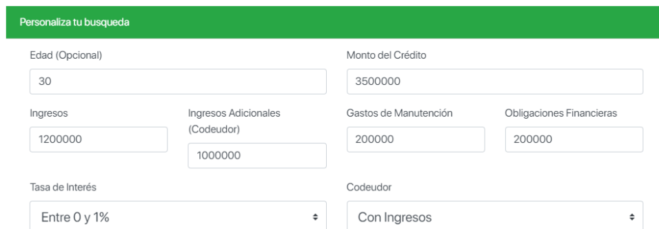
Imagen 1. Ingreso de información a programa crédito educativo

Para poder determinar el valor del crédito, al que podrá acceder es el 40% de sus ingresos registrados en el mismo, lo anterior solo se afecta si el usuario tiene otras obligaciones que disminuyen este 40%, planteando una cuota fija menor a asumir, por lo tanto afectaría la determinación del posible crédito, dando como resultado un valor menor. Así mismo se tiene en cuenta los ingresos adicionales que pueda tener el codeudor o familiar.