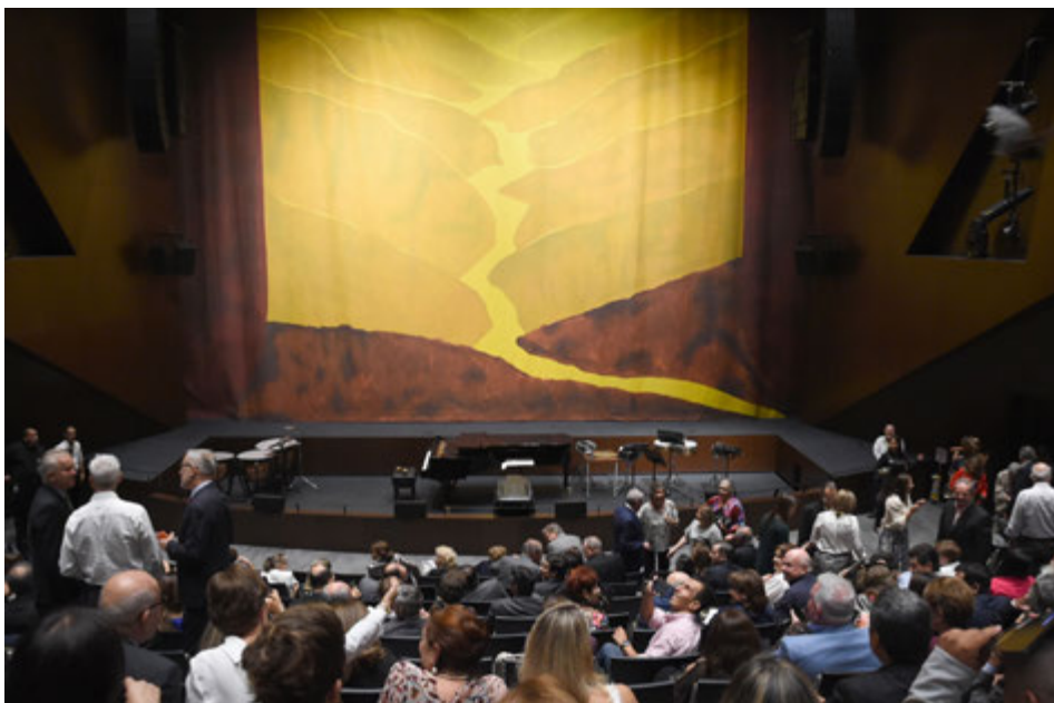
El imponente telón de boca con el cañón del río Chicamocha como motivo central es obra de la pintora santandereana Beatriz González Aranda y se constituyó en uno de los elementos que más llamó la atención de quienes tuvieron el privilegio de asistir al comienzo de esta nueva etapa del Teatro Santander en la noche del viernes 26 de abril, así como los días 27 y 28 del mismo mes. La acústica arquitectónica fue realizada por Andrés Núñez y la empresa Psicoacústica, contando con la asesoría de sonido de Juan José Virviescas.