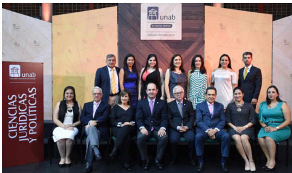
La Maestría en Derecho de Familia, de la Facultad de Ciencias Jurídicas y Políticas de la UNAB entregó 12 diplomas.