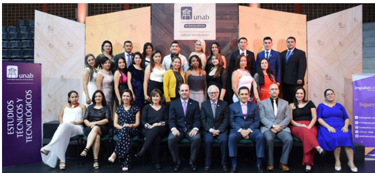
El Convenio UNAB - CES graduó a un grupo de 37 tecnólogos en regencia de farmacia.