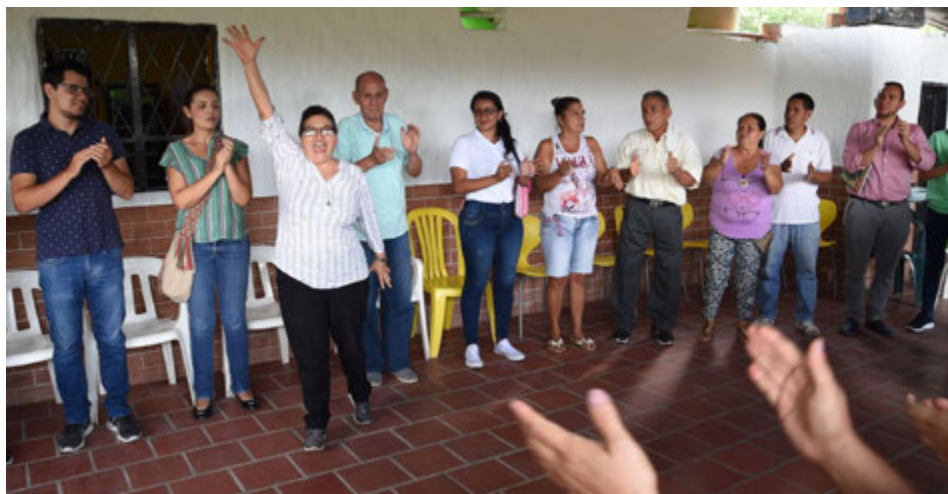
El entusiasmo de los participantes es uno de los principales motores del proyecto social que se realiza en la Ciudadela Nuevo Girón.