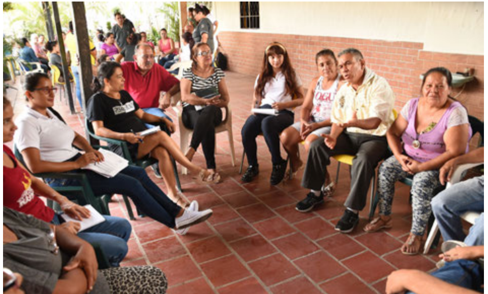
Religiosas de la Comunidad de Hermanas de la Presentación, así como estudiantes y docentes de la UNAB, junto a delegados de otras universidades e instituciones trabajan codo a codo con la comunidad de la Ciudadela Nuevo Girón, en su mayoría damnificados por la ola invernal del año 2005.

Es un modelo de desarrollo comunitario construido conjuntamente con la comunidad de la Ciudadela Nuevo Girón, que busca el mejoramiento integral de la calidad de vida de todos sus habitantes mediante la habilitación de los mismos para la gestión de la salud, de la educación, de la generación de ingresos (vía empleo y emprendimiento) y de la infraestructura social (vivienda digna). Estos cuatro componentes se soportan en cuatro pilares de habi-