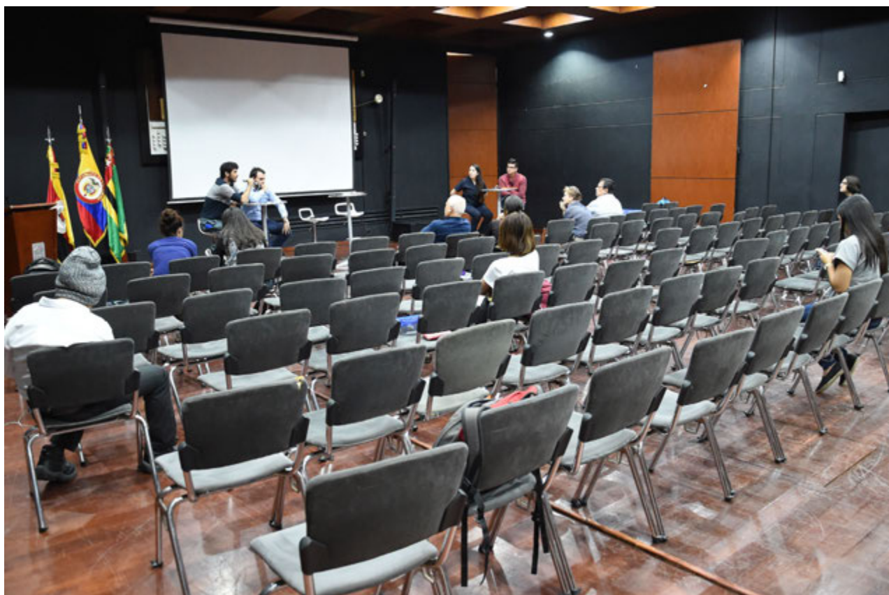
El pasado 18 de octubre se llevó a cabo en el Auditorio 'Jesús Alberto Rey Mariño', el debate entre las dos parejas de candidatos al cargo de representantes de los estudiantes ante la Junta Directiva de la UNAB. El evento fue moderado por el director de Vivir la UNAB y la fotografía registra la asistencia que había a las 2:34 de la tarde, en un evento que debía empezar a la 2:00 pm y se extendió hasta las 4 pm.