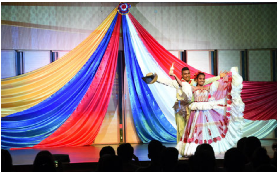
La Semana del Tecnólogo incluyó una representación artística de estudiantes de la UNAB.