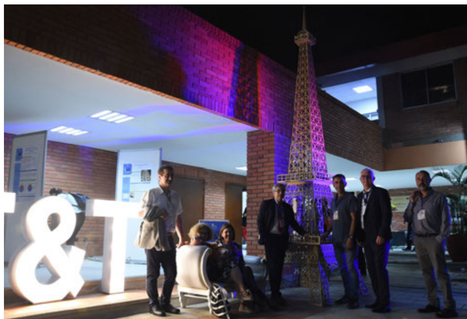
La delegación francesa se sorprendió con esta réplica de la Torre Eiffel de París.

En Colombia hay 212 programas a nivel técnico profesional y 526 tecnológicos en instituciones públicas (36%), mientras que en el sector privado hay 430 y 754 respectivamente (58%), sin contar los 122 (6%) del Sena, para un total de 2.044 programas. El 28% (570) de los programas vigentes es ofrecido por universidades y apenas 90 cuentan con Acreditación de Alta Calidad.