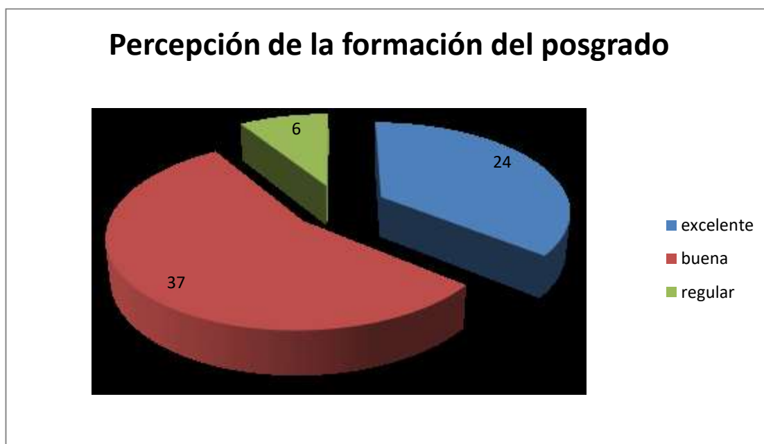
Grafica No. 2: Percepción de los egresados sobre la formación en el postgrado.

La percepción que tienen los egresados sobre la formación en su postgrado se muestra en la grafica No. 2