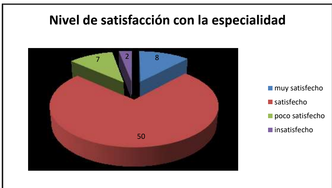
Gráfico No. 3: Nivel de satisfacción respecto a la especialización

La satisfacción que expresaron los egresados acerca de su especialización se observa distribuida en el siguiente gráfico: