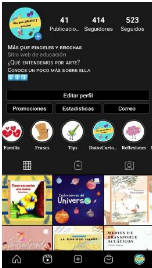
Perfil en Instagram - Más que pinceles y brochas

Durante el compartir con la comunidad de Instagram se lograron visualizar estadísticas sobre los seguidores, actualmente 414, de los cuales: el 56% pertenece a España, 20% de Colombia, 6.8 de Argentina, 4.7% de Chile y 2.8% de México. Lo cual indica que la página ha logrado un alcance a nivel internacional.