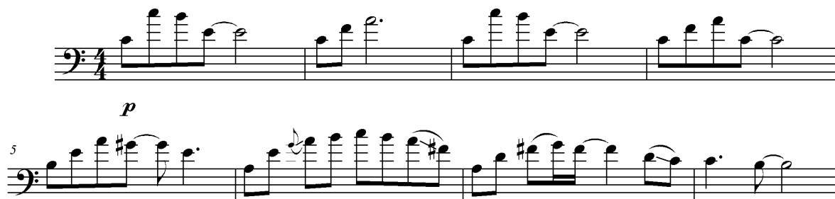
Ilustración No. 1

En la sección A entra la guitarra eléctrica (sin distorsión) presentando la melodía mientras es acompañada por el bajo, que hace los arpeggios de la introducción con una pequeña variación en el compás 14. También la batería entra en esta sección, con acompañamiento a criterio del músico de acuerdo al tema presentado por los otros dos instrumentos. ( Ver ilustración No. 2 )