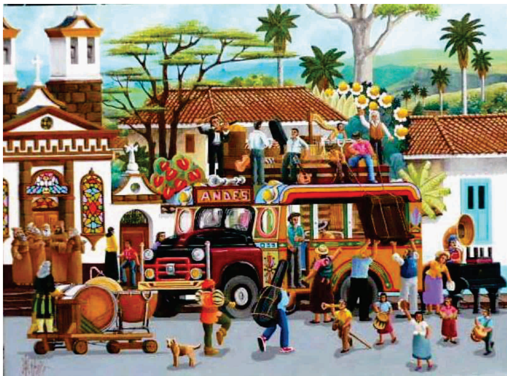
Con su música a otra parte