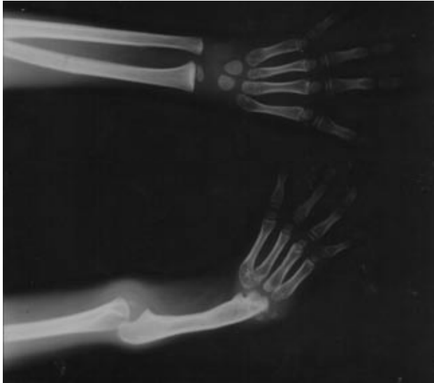
Figura 2. Aplasia radial izquierda (hemimelia paraaxial radial). Ausencia del primer dedo en ambas manos.

mano y ausencia de los huesos carpianos radiales en la mano izquierda (Figura 2).