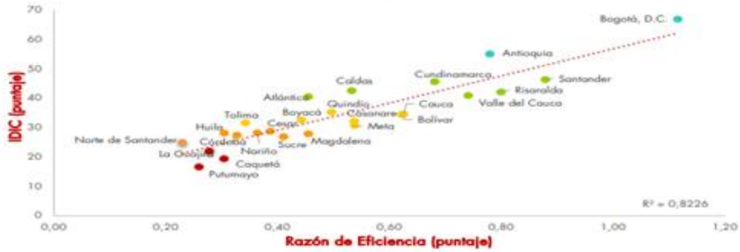
Gráfico III-3. Relación entre la razón de eficiencia e Índice Departamental de Innovación (IDIC)