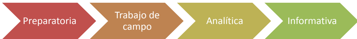
Figura 2. Fases de la investigación cualitativa

Cuenta con cuatro fases fundamentales en el proceso de investigación cualitativa.