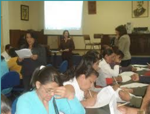
ENCUESTA A PADRES