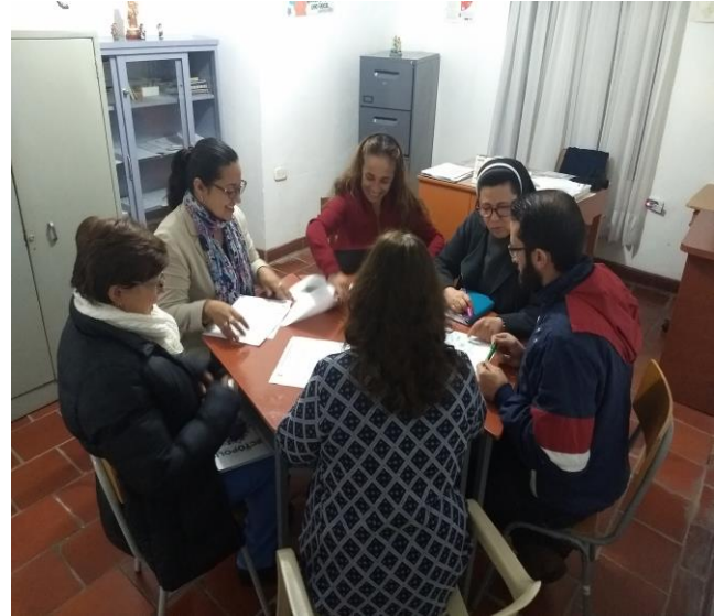
Socialización Propuesta y proyecto de investigación "Fortalecimiento de la Expresión Oral". A la Gestión de Calidad.