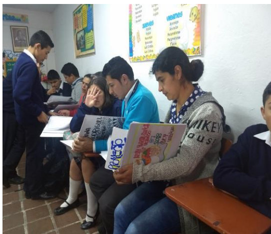
Socialización Propuesta y proyecto de investigación "Fortalecimiento de la Expresión Oral". A Padres de familia.