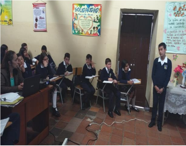
Exposición en el aula de clase. IEBB Fuente. Fotos Ludy Valencia.