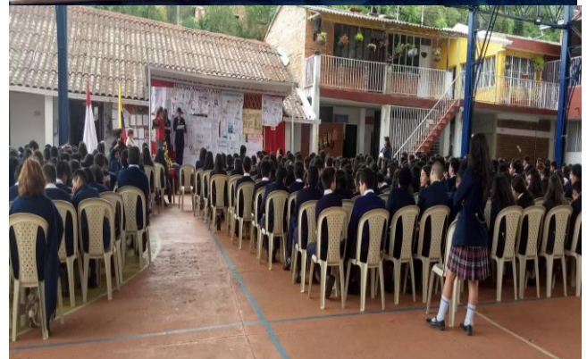
Socialización concurso de producción de cuento institucional y municipal.