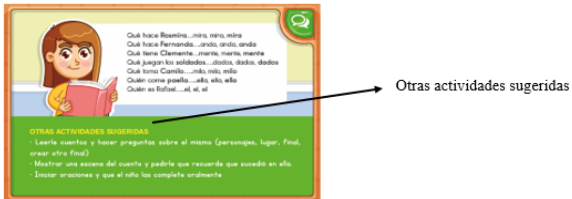
Figura 3. Modelo Tarjeta Batería. Vista al respaldo