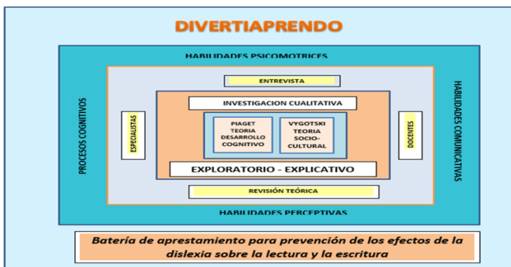
Figura 1. Diseño de la investigación

La muestra tomada para la recolección de información, fue seleccionada entre la población de docentes de grado preescolar y primero que laboran actualmente en dos instituciones del municipio de Floridablanca - Santander, una de las cuales pertenece al sector privado y la otra al sector oficial. También, se incluyó personal experto en el trabajo con niños con dificultades de aprendizaje: fonoaudiólogo, psicólogo, neuropsicólogo; para un total de 11 profesionales; quienes, a través de entrevistas estructuradas, aportaron sus conocimientos y experiencia a esta investigación. (ver Figura 1)