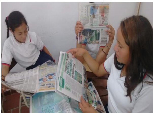
Figura N°5: Actividad de cierre de la intervención pedagógica N°1 análisis del periódico, análisis de noticias.

Hay muchas inquietudes en los jóvenes, la práctica de este tipo de herramientas no es tan usual, se les dificulta la ubicación de la información, para ellos les es más fácil responder preguntas que estén explícita en el texto, pues los mapas mentales requieren de un grado mayor de comprensión lectora pues requiere transmitir una información de una forma gráfica, transfiriéndose la imagen de los pensamientos hacia el papel, lo que le permite identificar de forma precisa que es lo que realmente desea, sin divagaciones y poner en función la acción, es decir de aquello que se consigue comunicar.