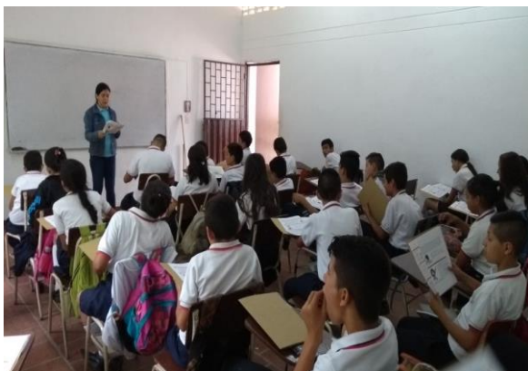
Figura N° 1: Fotografía de los estudiantes de séptimo grado desarrollando el primer taller” leo para informarme y aprender”.

relacionan los hallazgos de las intervenciones pedagógicas y actividades que fueron relevantes para cumplir los objetivos de esta investigación