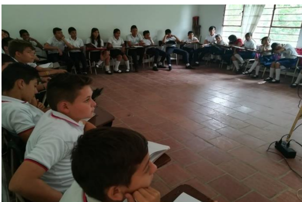
Figura N°7: Actividad de Inicio del sobre el taller textos expositivos, de la página Colombia aprende

de lo que hay explícito en el texto y para finalizar las actividades se propusieron actividades de responder, completar información así mismo se hizo una retroalimentación grupal, después de la actividad para evaluar la efectividad de la estrategia, donde en un alto porcentaje logro entender los tres tipos de lectura y que es necesario esforzarse por sacar sus propias conclusiones de un texto, para encontrar información importante que no está explícita en el texto, además que es importante tener una postura crítica frente a las opiniones y mensajes que vamos a expresar de acuerdo a lo leído.