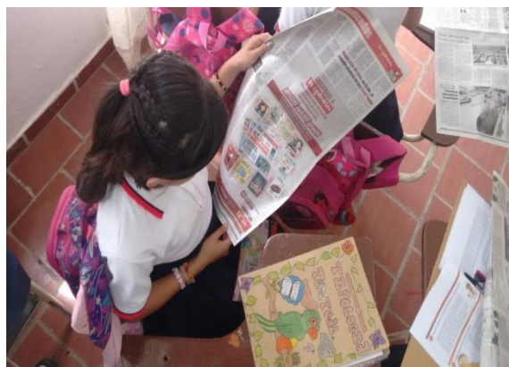
Figura N° 4: los estudiantes investigado textos informativos para realizar la actividad y la construcción de significados

La adquisición de la lectura y la escritura son experiencias que están enmarcadas dentro de esta investigación con el fin de fortalecer los niveles de comprensión lectora en los estudiantes, para ello en el segundo punto de la actividad se les pide los jóvenes en grupos de dos lean la información de los textos informativos y luego hagan un esquema mental, la importancia de esta actividad radica en que pueda acceder a la información de una forma natural y tranquila, para que leer y escribir se convierten en interacciones divertidas y placenteras.