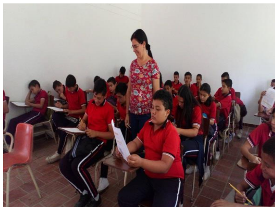
Figura N°6: Desarrollo del taller N°2 con los estudiantes de séptimo grado de la Instituto Técnico Agrícola del municipio de Gramalote

muchachos es querer saber si estas historias son hechos reales o ficticios, la explicación, obedece a que estos son hechos que de un u otro, forman parte de la cultura de determinada sociedad, es aquí donde los estudiantes hablan de los mitos de la región, cuentan historias que sus abuelos o antepasados les han contado, unos afirman que les tienen miedo a estas historias.