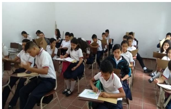
Figura N°9: Taller identificación de los elementos del reportaje, estudiantes de séptimo del Instituto Técnico Agropecuario Gramalote Norte de Santander

La actividad de introducción de los textos se inicia con la animación de un video ya que estos son herramientas importantes por que facilitan la adquisición del conocimiento a través de la imagen para que el lector pueda inferir el significado, luego del video debían responder preguntas de tipo literal e inferencial, el número de respuestas acertadas frente al anterior taller aumento notablemente, también se pudo evidenciar que en su mayoría lograron obtener respuestas acertadas de tipo literal, la que se constituye el nivel básico de lectura centrado en las ideas y la información que está explícitamente expuesta en el texto. Los estudiantes logran dar respuestas de reconocimiento de nombres, personajes, tiempos y lugar e identificaron la idea principal del texto