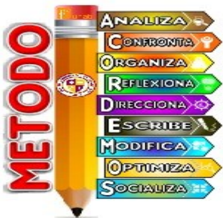
ilustración 1 método ACORDEMOS

UNAD. (1991). METODOLOGIA DE LA INVESTIGACIÓN II. En H. CERDA, COMPILACIÓN CON FINES INSTRUCCIONALES (págs. 106-109). CARACAS, VENEZUELA: UNAD.