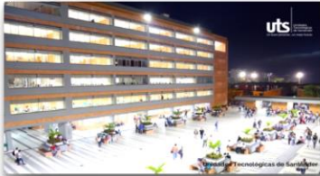
Sede principal de las UTS, Bucaramanga.

Fase cuantitativa Estudiantes de primer semestre que presentaron la prueba diagnóstica y de contrastación. Estadístico porcentual.